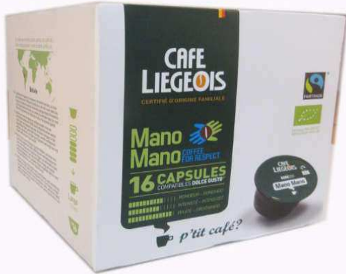
Unité de vente